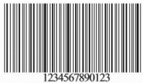
Izgled bar-koda za vozila